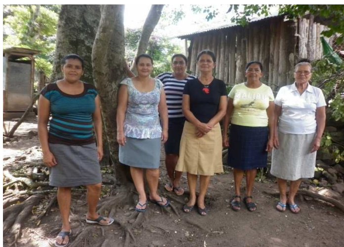
Junta Directiva de la Cooperativa de La Laguna.

Es va iniciar l'any 2006 amb l'aportació de 1000 € de l'Ajuntament de Cornellà del Terri; és un projecte gestionat per un col·lectiu de dones anomenat "El Esfuerzo".