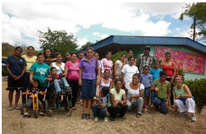
Reunió de mares de nens/es apadrinats (11-4-2015)

Per acord de les famílies dels nens apadrinats, es dedueix un 10 % de cada apadrinament i amb això són apadrinats dos nens més. És el que anomenen "apadrinament compartit". Així el total de nens apadrinats és de 21. Durant aquest any va morir una nena apadrinada.