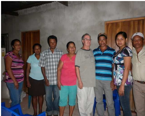
Junta directiva de la Cooperativa.

És el més jove dels projectes de microcrèdits, es va iniciar el 2007 amb el suport de 1000 € de Banyoles Solidària.