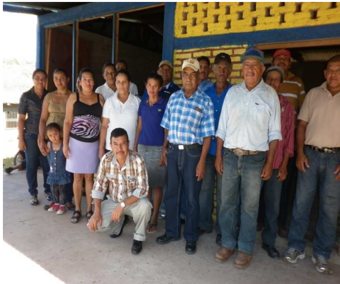
Assemblea de socis.

altra, repartida en microcrèdits entre els camperols beneficiaris. Tenen problemes amb alguns beneficiaris morosos amb els quals estan negociant la forma de pagament del deute.