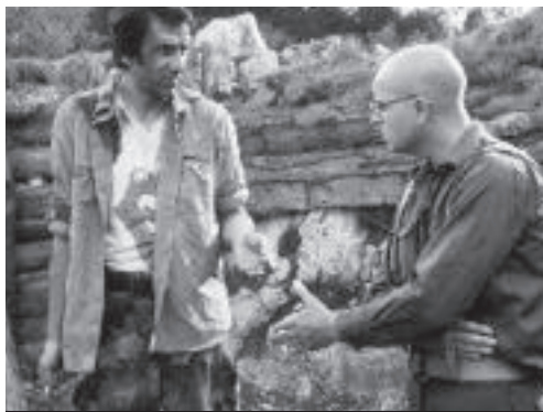
PROGRAMA DE MÀ - SECUNDÀRIA