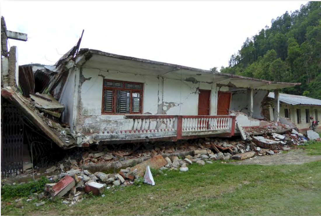
Residencia per nens cecs CHANDESWORY BLIND HOSTEL completament destruïda