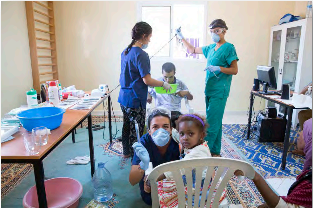
Dentistes voluntàries de Girona al CADA

Des de aquí volem donar les gràcies a tots els voluntaris que heu fet possible aquestes dades. Volem donar les gràcies a l'Ajuntament de Girona, Diputació de Girona i Universitat de Girona per recolzar el nostre projecte. I per últim a les autoritats locals de les comunes d'Aghbala, Tizi n'isly i Boutferdà per confiar en el nostre treball.