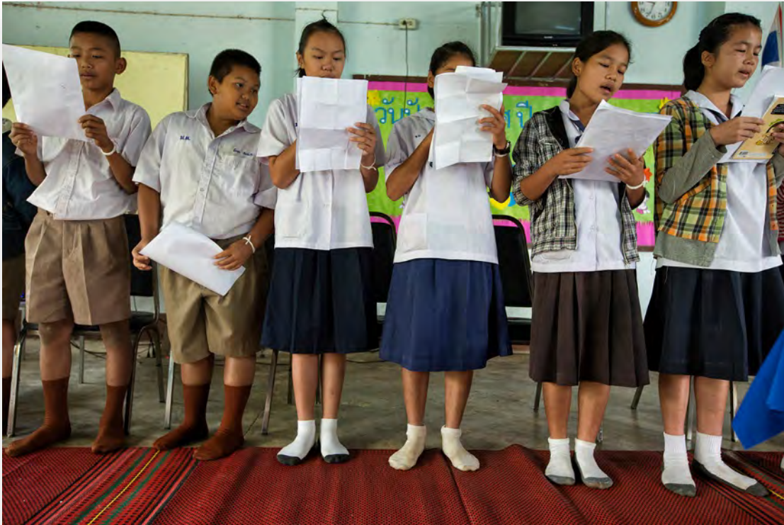
Els nens de Baan Saan Rak l'últim dia de l'escola

Com sempre NouSol ha enviat diferents voluntaris d'arreu del món a treballar a la casa d'acollida.