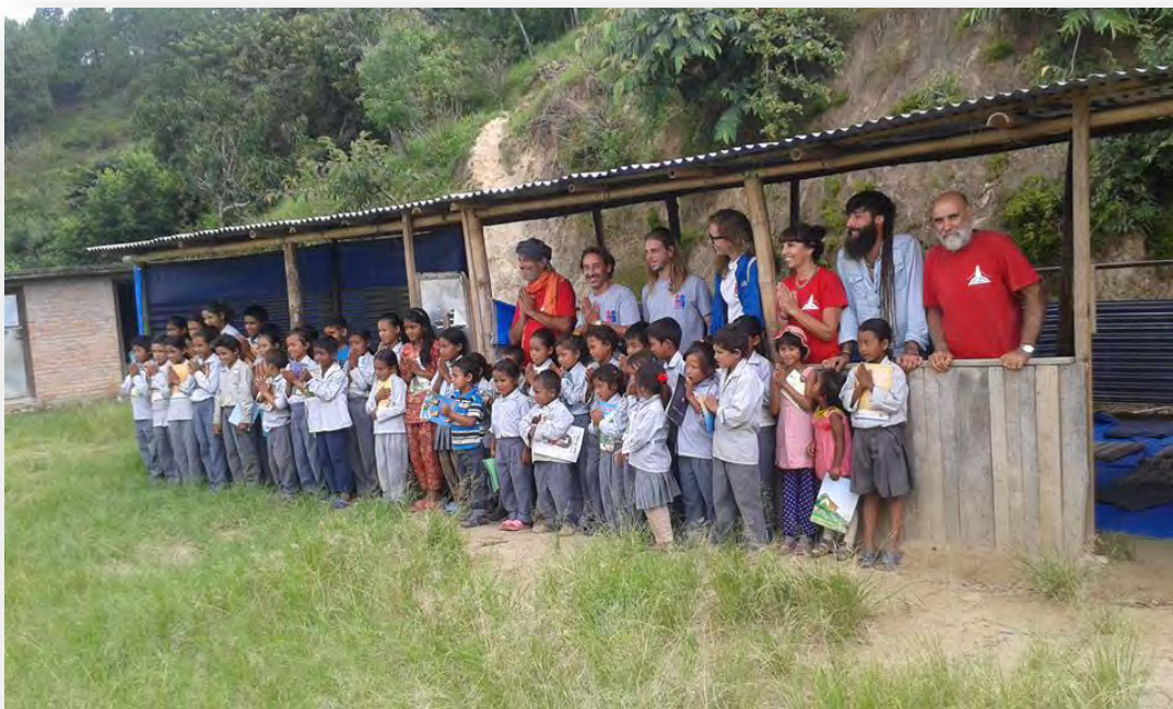
Escola Shree Sarashwotii Primary School