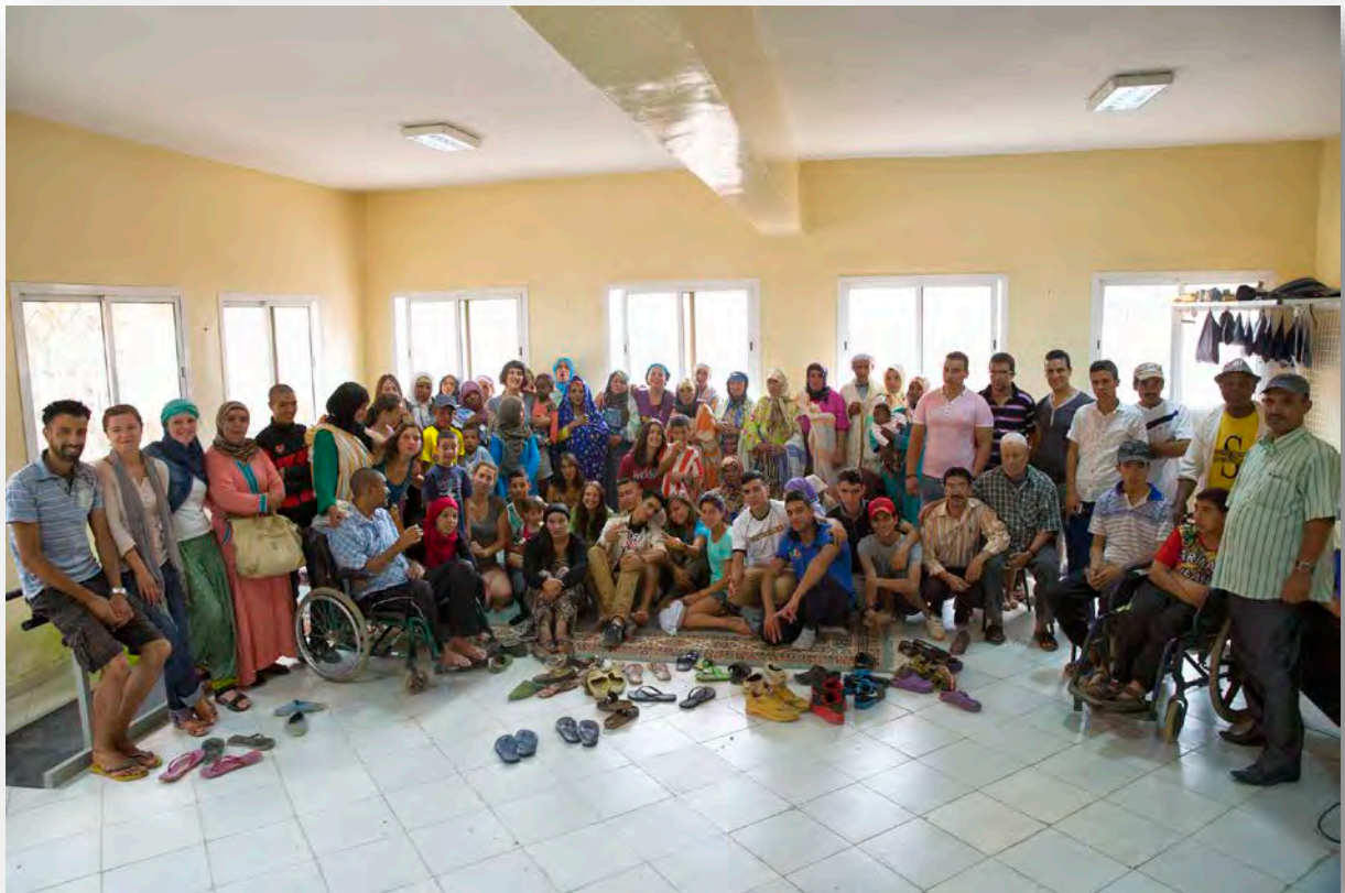
Sala de Rehabilitació i fisioteràpia al CADA

Gràcies a això estem obrint aquest Centre tant necessari en aquesta zona remota. Ara sobretot continuarem treballant per canviar la mentalitat respecte a com tractar els discapacitats.