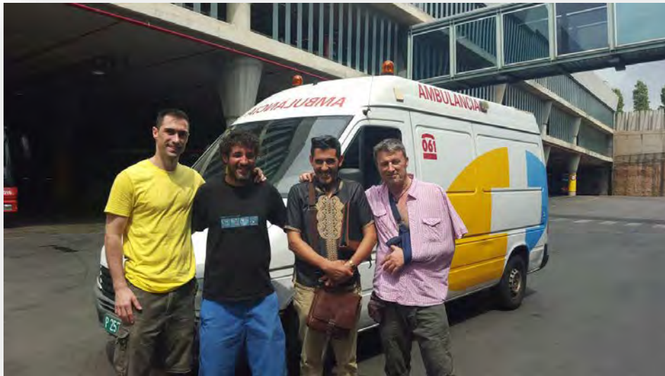
Conductors Solidaris de Catalunya fent la donació de l'ambulància

Després de dos anys de treball NouSol ha portat una ambulància al Projecte Aghbala. L'ambulància ens l'ha donat l'associació Conductors Solidaris de Catalunya i des de dimecres 7 d'octubre ja està a l'Associació de discapacitats d'Aghbala.