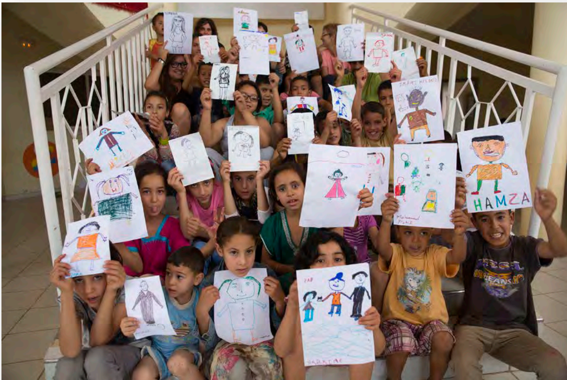
Casal d'estiu a l'associació de discapacitats d'Aghbala