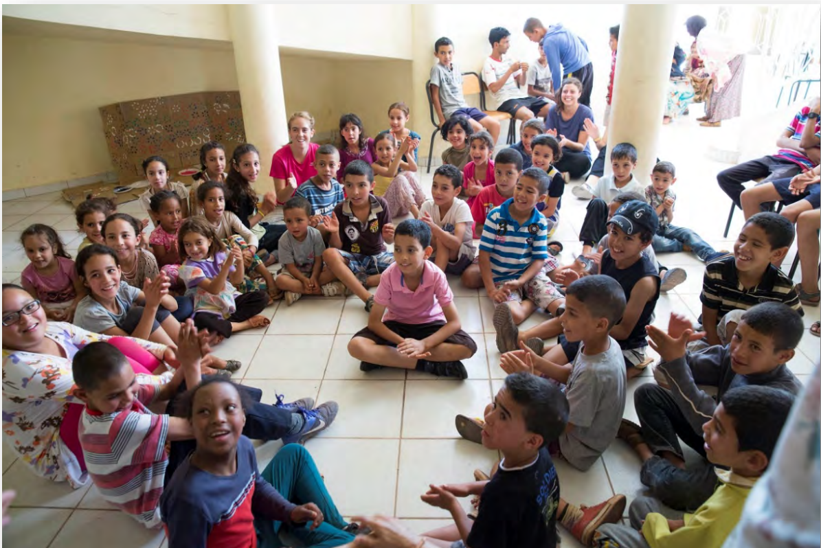
Casal d'estiu al Centre de discapacitats d'Aghbala

El treball en xarxa entre les 4 associacions ha sigut molt productiu i beneficiós pels nens i nenes d'Aghbala. Durant tot aquest estiu el Centre de discapacitats d'Aghbala s'ha convertit en l'Ateneu de la població gracies a la gran quantitat d'activitats que hem realitzat. Cursos d'espanyol, manualitats, esports, teatre, casalet d'estiu. En aquestes activitats han participat nens i nenes usuari-e/s de l'associació de discapacitats d'Aghbala. El principal objectiu ha sigut fer inclusió social i educar a tots els nens sobre altres capacitats.