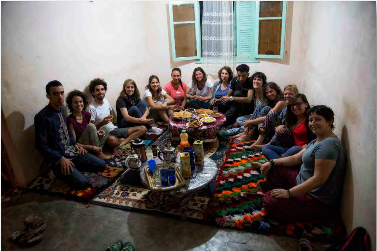
Voluntaris al Projecte Aghbala

La nostra força recau en el voluntaris. Gracies això podem treballar en tres projectes de Cooperació Internacional de gran envergadura. Enguany hem tingut 100 voluntaris que han participat en els camps de treball del Marroc, Tailàndia i Nepal. A més hem tingut també desenes de voluntaris que han participat en les activitats que hem realitzat a Catalunya. Entenem el voluntariat com a motor de canvi social al apropar realitats diferents. Des d'aquí agrair l'impagable feina humana que realitzen i on totes les parts surten molts beneficiades.