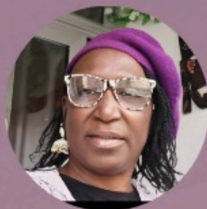
Bombo Ndir Presidenta de ADIS y activista en DDHH