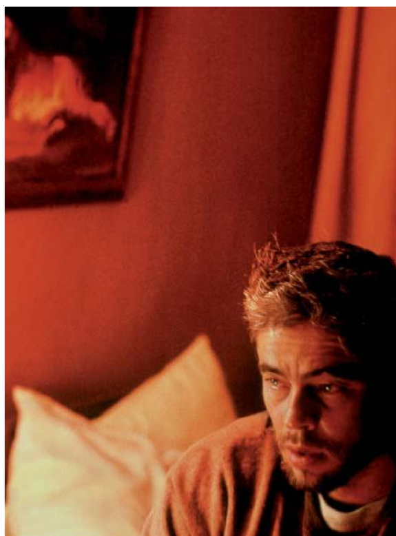
21 gramos (2003) de Alejandro González Iñárritu

Dada la importancia del trabajo preventivo en este ámbito y el interés que suscita el tema en la actualidad, las propuestas orientativas que ofrecemos pueden ser un punto de partida para favorecer la Educación Vial de una forma global junto a las aportaciones de profesionales especializados, docentes, alumnado, familias y demás agentes sociales.