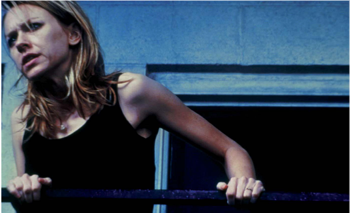
21 gramos (2003) de Alejandro González Iñárritu

Existen algunos factores de mejora que pueden incluirse en el desarrollo de posibles unidades de trabajo interdisciplinar para incrementar su efectividad, por ejemplo: