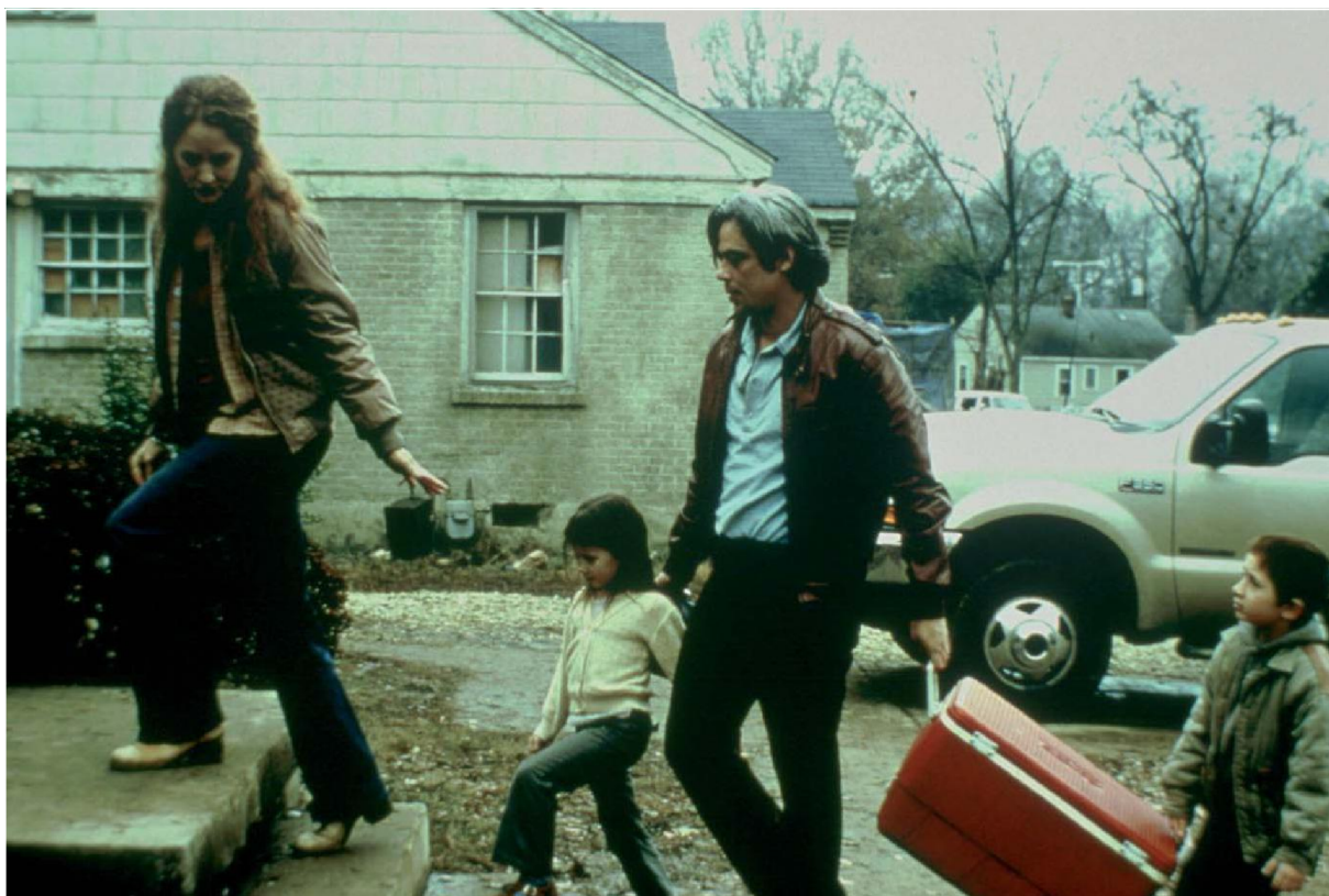
21 gramos (2003) de Alejandro González Iñárritu

• Conjuntamente reflexionamos sobre qué tipo de aprendizaje final deducimos de la película 21 gramos .