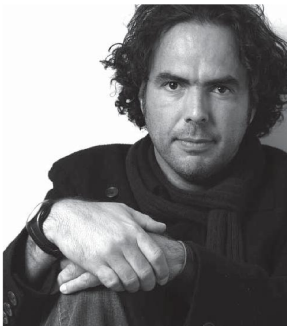
Alejandro González Iñárritu

En el año 2006 se estrenó Babel . En el Festival de Cannes obtuvo el premio al mejor director. Un año más tarde consiguió el Globo de Oro a la mejor película de género dramático y fue candidata a seis premios Oscar, entre ellos a Mejor Película