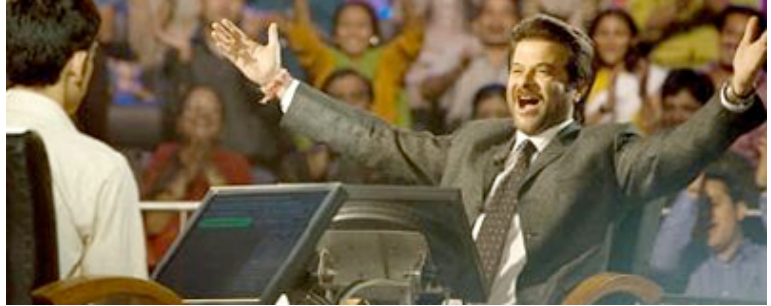
Prem, el presentador de TV.

Anil Kapoor es un actor muy popular en la India. Ha participado en casi un centenar de producciones indias, por las que ha recibido numerosos reconocimientos, entre ellos 4 premios Filmfare, equivalentes indios de los Oscars de Hollywood. La ONG Plan International informó en 2009 que Anil Kapoor decidió donar todos los ingresos obtenidos en ‘Slumdog Millionaire’ para una campaña internacional en defensa de los derechos de los niños y niñas.