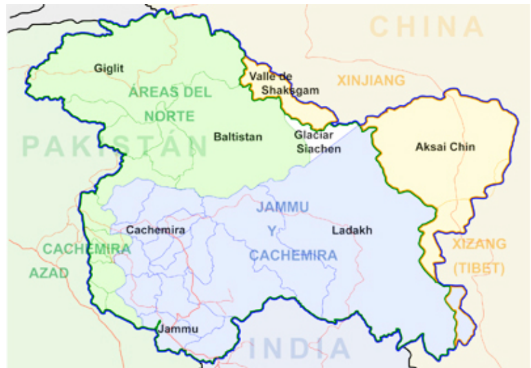
El valle de Cachemira, Jammu y Ladakh componen el estado indio de Jammu y Cachemira. De Wikipedia.

El atentado del Samjhauta Express fue un ataque terrorista que tuvo lugar el 18 de febrero de 2007 en ese servicio ferroviario que conecta Delhi (India) con Lahore (Pakistán). Las bombas estallaron en dos vagones llenos de pasajeros, a 90 kilómetros al norte de Nueva Delhi. En el incendio murieron 68 personas y 50 resultaron heridas . La mayoría de las personas fallecidas eran civiles pakistaníes, pero entre las víctimas había también civiles indios y personal militar indio que vigilaba el tren. Los conflictos entre extremistas hindúes y musulmanes continúan en la actualidad —atravesados por una mutua intolerancia religiosa, teñida de un nacionalismo exacerbado— y provocan numerosos atentados terroristas. Uno de los últimos fue el ataque al centro turístico de Mumbai, realizado en 2008 por un grupo extremista musulmán de Cachemira.