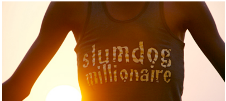
Slumdog millionaire, perro callejero millonario.

Literalmente, perro callejero. En la India los slum son los barrios marginales de cualquiera de sus grandes ciudades . Mientras que en el resto del mundo la media de población urbana asentada en estos barrios es del 33%, en la India alcanza el 55%. Más de la mitad de la población urbana malvive en un slum sin educación, sanidad, protección social, oportunidades de empleo, electricidad y agua potable. Esta ha sido la infancia de Jamal, nacido en un slum de Mumbai. Es un chico de la calle, un ‘perro callejero’.