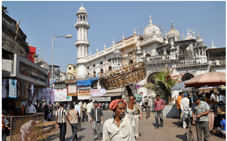
Templos suntuosos y pequeños comerciantes en una calle de Mumbai.

Dice Aaj Sahni (3) : “La Unión India constituye un sorprendente caso de contrastes. (...) Existe, entre la élite india, una enorme confianza, la seguridad y la certeza de quien se dispone a conquistar el mundo; (...) un sentimiento respaldado por un crecimiento sostenido de la economía, que entre 1993 y 2003 creció un constante 6 por ciento y en los últimos cuatro años ha alcanzado un notable 9 por ciento”. (4)