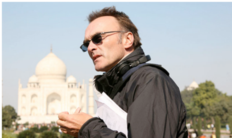
El director durante el rodaje de la película.

'Slumdog Millionaire' (2008), con sus numerosos premios, le proporcionó el reconocimiento internacional en el ámbito de la dirección cinematográfica.