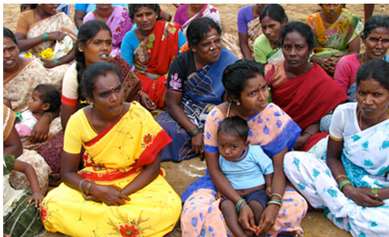
Múltiples grupos de mujeres reivindican sus derechos en India.

La tasa de alfabetización de las niñas es todavía menor que la de los niños. Éste es el principio de una larga lista de restricciones que sufren las mujeres . Aunque en las ciudades las mujeres son una parte considerable del sector productivo (30% en la industria del software), en muchos lugares del norte del país, más tradicional que el sur, aún está mal considerado que una mujer trabaje en el sector público. Es la explicación de que el 90% de las mujeres indias que trabajan lo hacen en el sector informal –servicio doméstico y pequeño comercio– con escasa retribución y prácticamente nula protección social.