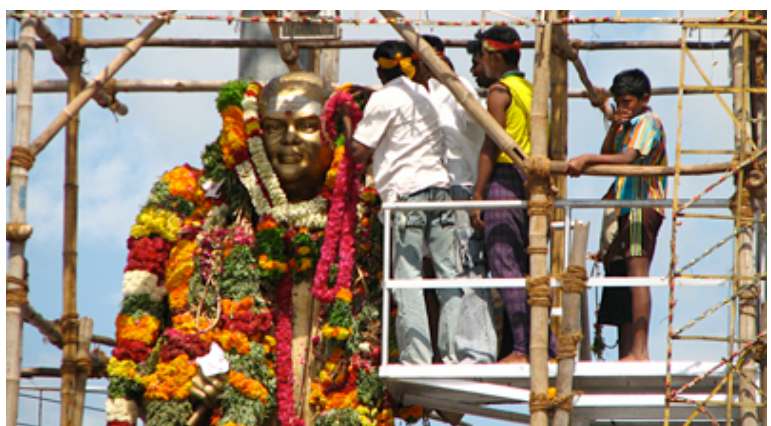
Un grupo de hombres adornan la estatua de Thevar en Madurai.

Más del 90% de los habitantes de la India profesa alguna religión. De ahí la afirmación de que la India sea uno de los países del mundo con mayor diversidad religiosa . Las principales religiones practicadas en la India son el hinduismo (79,8%) y el islam (13,7%). Hay también jainistas, sijs, zoroastrianos (parsis), budistas, así como judíos y cristianos resultantes de una evangelización muy antigua (en Kerala y Karnataka) o consecuencia de la llegada de los europeos: portugueses, franceses e ingleses. Detrás de los porcentajes de las religiones no hinduistas –a primera vista no muy destacables– hay cifras sorprendentes. En la India hay actualmente 150 millones de musulmanes, lo que sitúa a India en el cuarto país del mundo en número de creyentes musulmanes.