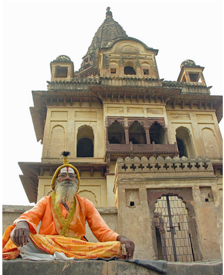
Los brahmanes conforman la casta superior de la India y la que oficia los ritos del hinduismo. Por Dennis Jarvis.