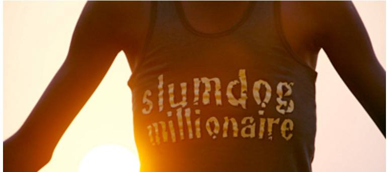
'Slumdog Millionaire': 'Perro callejero millonario'

Antes del visionado de la película proponemos detenernos en dos aspectos fundamentales. El cinematográfico (dirección, personajes principales y técnica utilizada) y el escenario de la película (apuntes sobre características y retos principales de la sociedad india).