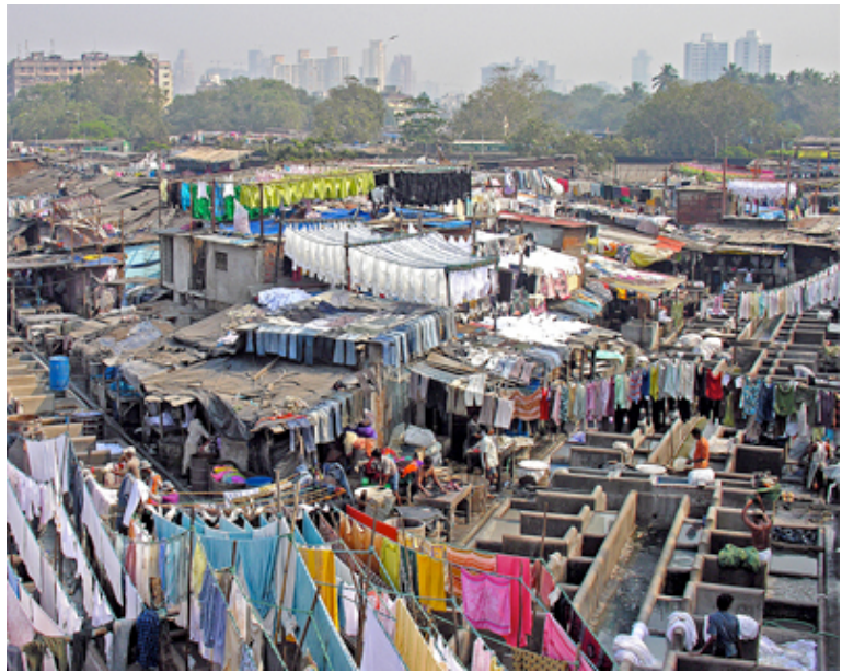
Lavaderos populares en Mumbai.

Las previsiones de crecimiento urbano en la India indican que la población urbana se duplique en 2020: de 285 millones en 2001 a 540 millones en 2020. Las más que débiles infraestructuras y sistemas de gobernabilidad urbanas suponen un reto considerable para el desarrollo indio. Por otra parte, la concentración de sectores punteros muy determinados vinculados con la alta tecnología agravará el desequilibrio que existe actualmente con el mundo rural. Podrían aumentar las tensiones ya existentes entre ambos mundos.