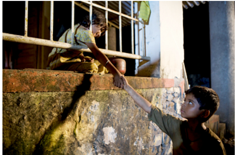
Salim con Latika. Este personaje femenino funciona como resorte dramático de la historia.

Jamal, Salim y Latika componen este "trío de mosqueteros" en torno al cual se construyen la trama y subtramas de la película. Jamal, que encarna a nuestro particular antihéroe, se acaba convirtiendo en el héroe de toda una nación . Su objetivo es encontrar y reunirse con Latika (trama amorosa), el detonante de que participe en el concurso. Decimos que Jamal funciona como antihéroe porque no busca la fama o el éxito que le llega de golpe sino que le sucede de manera secundaria, casi como recompensa a esta lucha por su amor, por una parte, y a su supervivencia como "perro callejero", por otra.