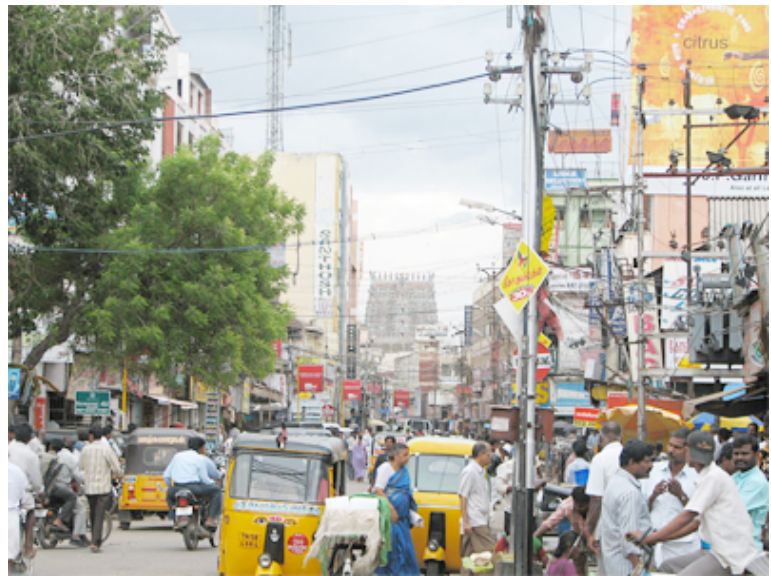
Una bulliciosa calle del centro de la ciudad.

Es el séptimo país más extenso del planeta , con 3.287.590 km 2 (España tiene una extensión de 504.645 km 2 ). Los países con los que comparte fronteras –Pakistán, Bangladesh, Nepal, Sri Lanka, Myanmar y China– viven conflictos internos desde hace años. Por tanto, la India se encuentra en un escenario estratégico delicado. La rivalidad con Pakistán a causa del territorio de Cachemira –un problema sin resolver– es un elemento fundamental de la inestabilidad regional y ha provocado varias guerras. Algo parecido, aunque en menor medida, sucede con China.