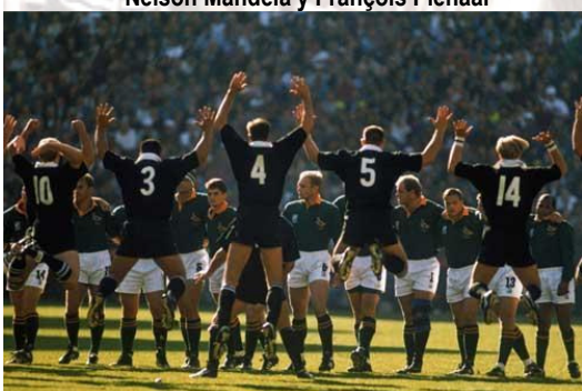
Haka de los All Blacks en la final, 1995