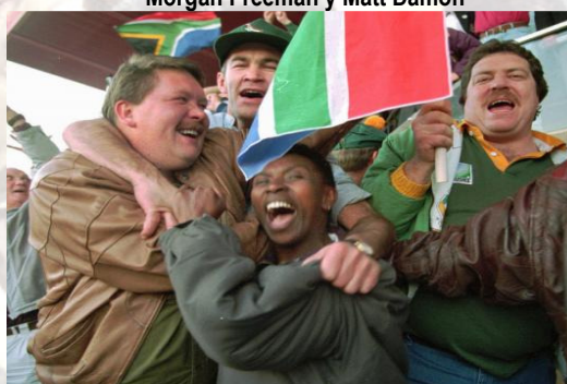
Aficionados celebran la victoria en la final, 1995