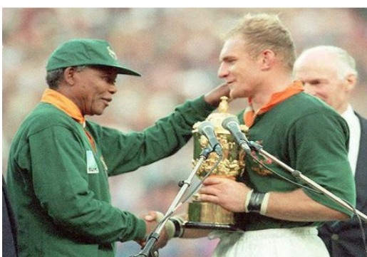
Nelson Mandela y François Pienaar