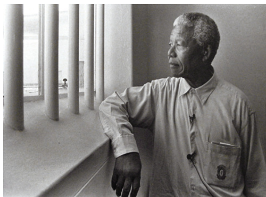
Mandela visita su antigua celda en Robben Island