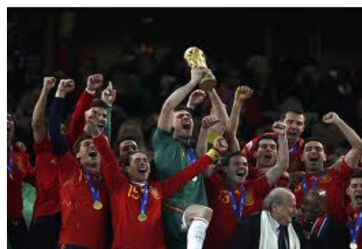
Final Mundial 2010