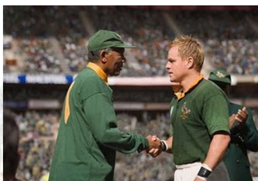
Morgan Freeman y Matt Damon