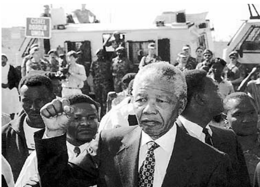
11 de febrero de 1990, Mandela sale de la cárcel después de 27 años preso