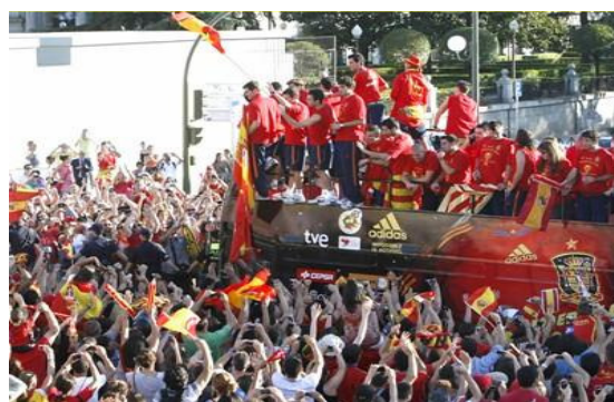
Celebración de la Copa del Mundo 2010