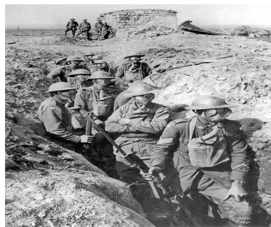
Soldados australianos se protegen ante un posible ataque con gases venenosos