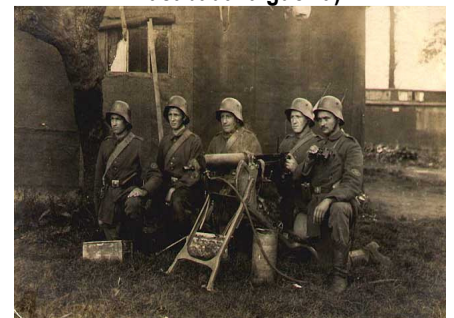
Soldados alemanes manejan una ametralladora Maxim

Podéis ver más imágenes similares en las siguientes direcciones: