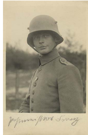
Con el "casco 1916"