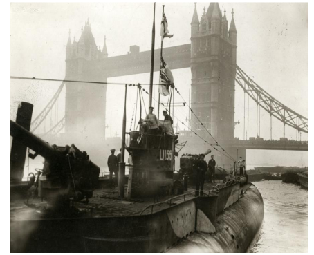
Submarino alemán en el Támesis (en 1918, acabada la guerra)