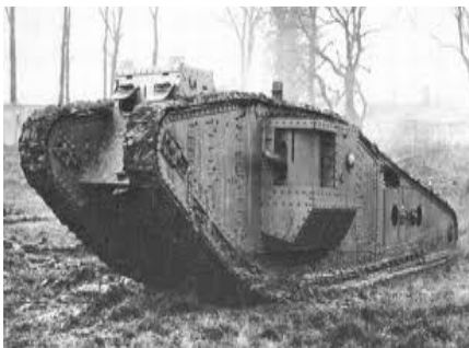
Carro de combate de la I guerra mundial